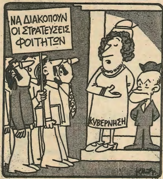
— 'Η στρατεύσεις είναι δι' όλους. Ρωτήστε και τον κύριο...

Αυτή είναι η κυρία αποστολή του σοσιαλισμού: να προσφέρει σε κάθε άνθρωπο την πραγματική δυνατότητα να γίνει άνθρωπος, δηλαδή δημιουργός σ' όλα τα επίπεδα της κοινωνικής του ζωής: στην οικονομία, στην πολιτική, στην κουλτούρα.